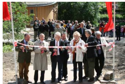
Eröffnung am 14.05.2009

Die Sparkassen-Stiftung Stormarn finanziert einerseits den Einsatz speziell ausgebildeter Förster und Försterinnen (der Landwirtschaftskammer Schleswig-Holstein), die vor Ort die pädagogischen Aktivitäten mit Kindern, Erziehern und Lehrkräften durchführen, andererseits sorgt sie für die organisatorische Abwicklung (vor allem der Vereinbarung der Termine) in Verbindung mit dem Kreisjugendring Stormarn e.V. sowie den Transport der Kinder mittels Bussen (durch die Firma Autokraft).