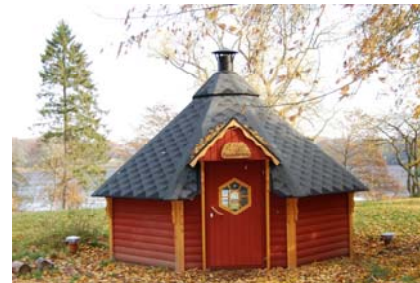
Kota „Kaninchenbau“ der Sparkassen-Stiftung

Die Sparkassen-Stiftung Stormarn hat dabei die Kosten für den Niedrigseilgarten übernommen und drei eigene Kotas sowie sechs Container zur Unterbringung von Spielfahrzeugen für die Kindergartenkinder auf dem Gelände in Grabau errichtet.